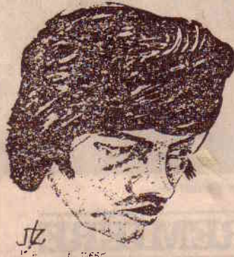
Den unge filippinske stormester Torre er den ene som har klart å beseire verdensmester Karpov.

Denne beskyldningen skal man ikke få hengt på den nuværende verdensmester, sovjetrus-