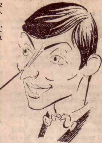
Anatolij Karpov har bare tapt to partier av 78 siden han ble ver- densmester.

Torre var i kraftig tidsnød og var nu ikke klar over at han had- de gjort 40 trekk (kontrollserien). Ellers hadde han utvilsomt sett 41. -Lxb2+! 42. Kxb2 Df2+ og matt.