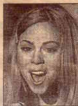
På lerretet. Mariah Carey

- Mariah har utseende med seg og en fin personlighet. Hvis hun i tillegg viser seg å være en knall skuespiller, blir det en bonus for oss alle, sier Chris Tucker. (NTB)