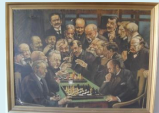
Figur 3 Gamle storheter