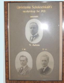
Figur 6 Klubbmesterskapet 1921