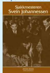
Figur 15 Boken om Svein Johannessen