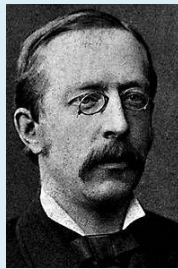
Figur 5 Otto Blehr, statsminister i Norge under unionstiden med Sverige og «anseet for Norges flinkeste Skakspiller»