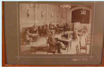
Figur 2 Leonhardt holder simultan i 1907