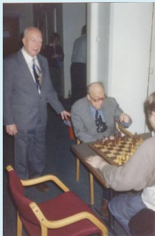
Figur 17 Haugestøl (Tollboden) og Hasselberg