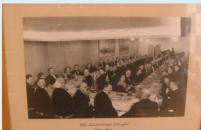
Figur 7 OSS' 50 årsjubileum