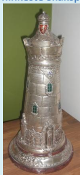
Figur 8 Christiania Schakselskab spilte en triangelmatch mot København og Stockholm i 1922 og sølvstårnet var premien